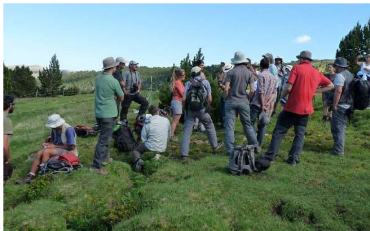
Photo 1 : les premières rencontres du réseau FloraCat remontent à 2012.

S'élargissant au fil du temps, ce réseau est la clef de voûte du partenariat transfrontalier souhaité et animé dès lors par la Fédération des réserves naturelles catalanes. Ce partenariat a donné récemment naissance au projet Floralab.